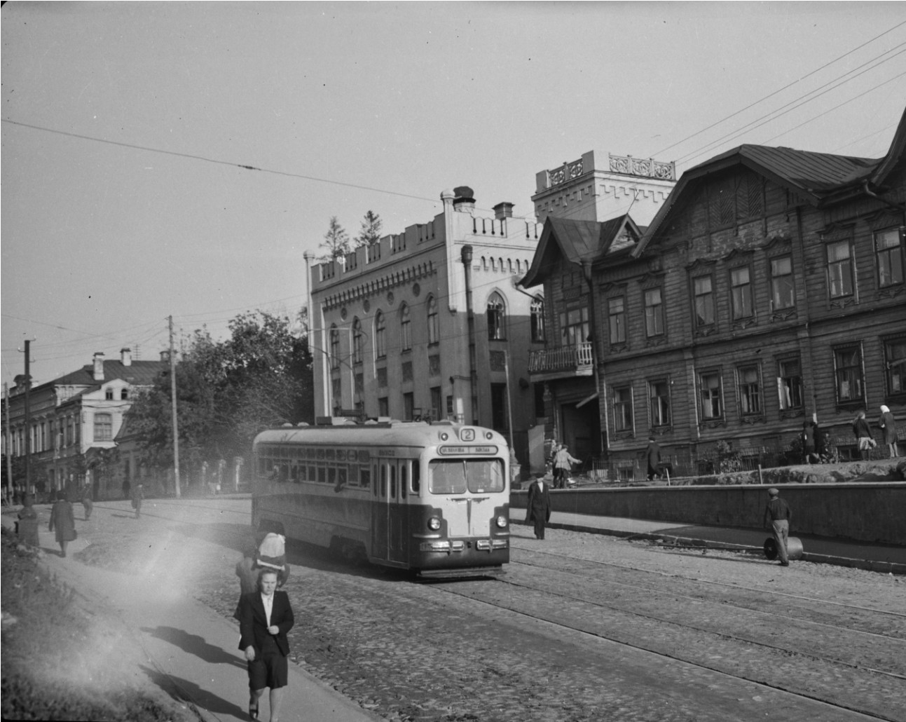
Фрагмент фотографии середины XX века.. Хорошо видна утраченная труба центральной печи.